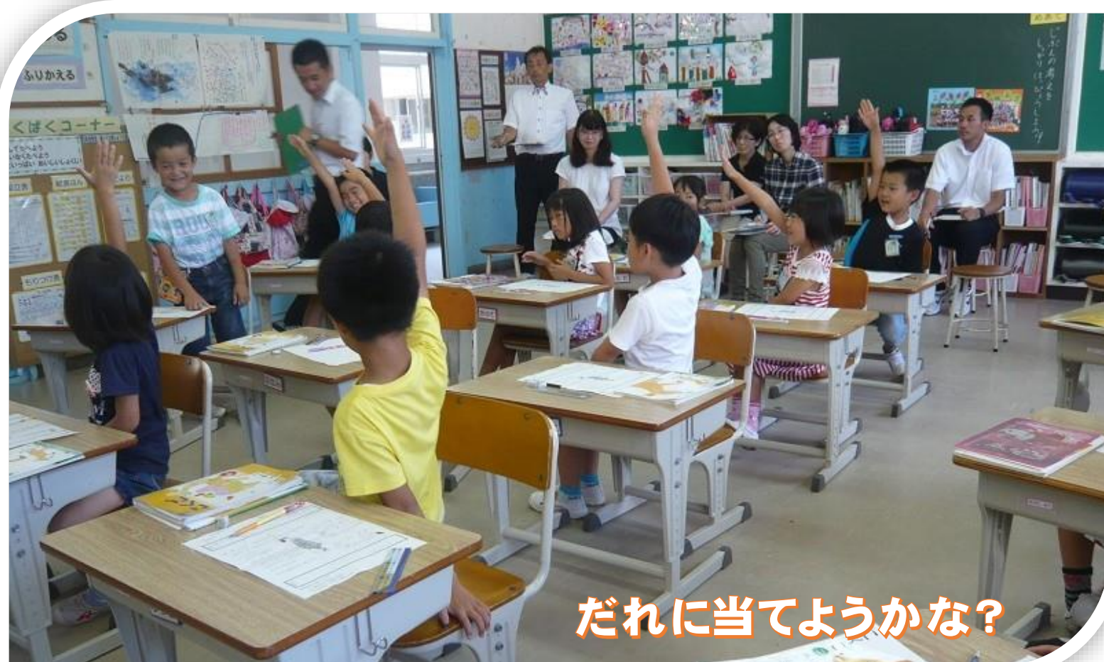
だれに当てようかな?