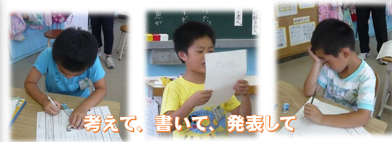
考えて、書いて、発表して